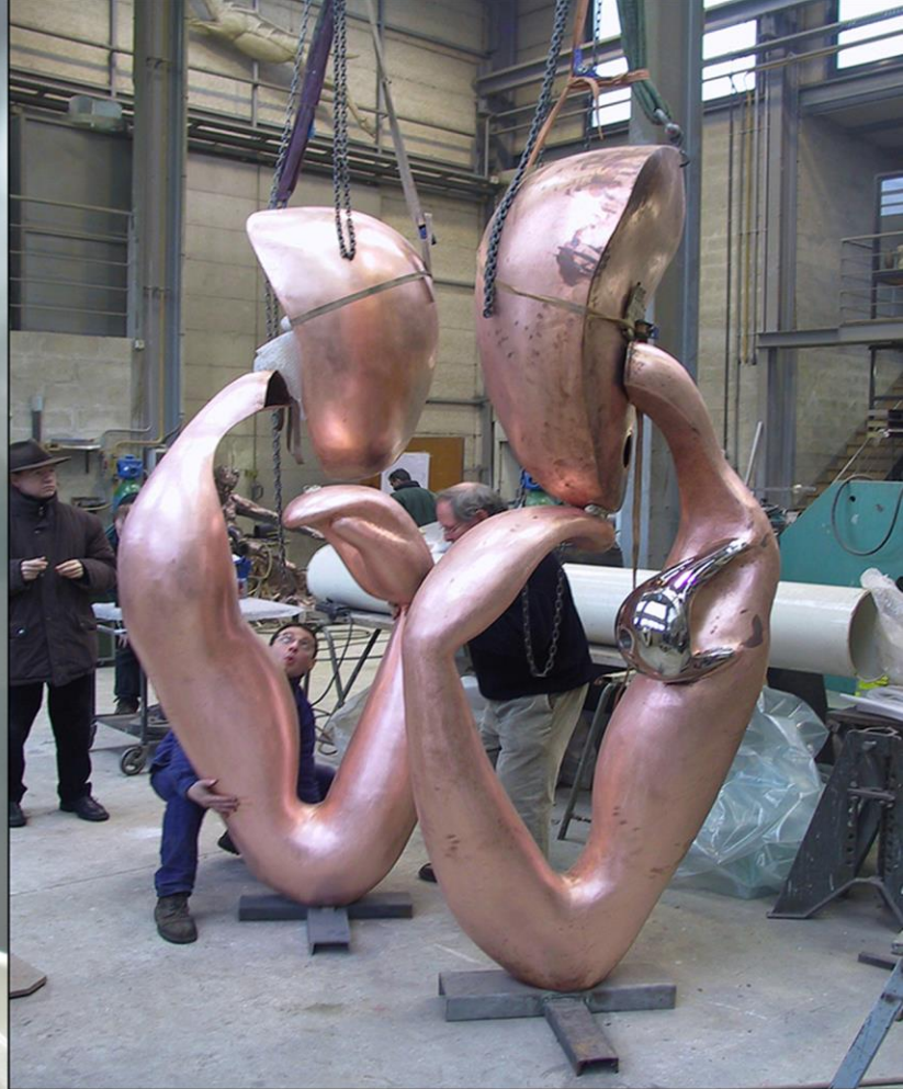
Working on the monumental sculpture «Rêves et Regards» at the Coubertin Foundry

Préparation de la sculpture monumentale «Rêves et Regards» à la Fonderie Coubertin