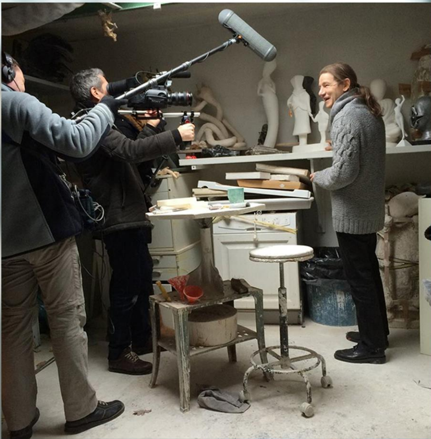
Reportage France 5